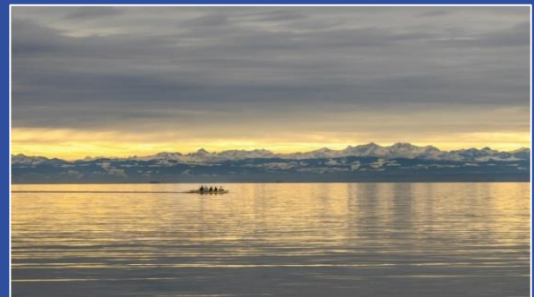
Ausblick vom Seecampus

Veranstaltungsseite des Lehrstuhls: zu.de/zukunftssalon