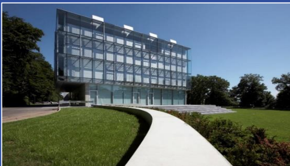
Seecampus der ZU

Alle üblichen Maßnahmen und Hygienekonzepte werden wir anwenden, sodass wir im Rahmen der Regeln eine hervorragende und schöne Präsenzveranstaltung werden machen können.